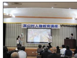
二次被害シミュレーション