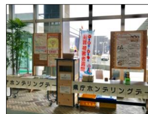
県庁ホンデリングプロジェクト