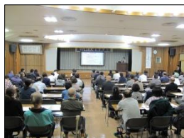
油井事務局長による講義

高山村人権教育講座では、油井事務局長による講義と、支援事業員による「こんなとき、あなたなら・・・」と題した二次被害シミュレーションを、支援事業員が寸劇形式で行った。