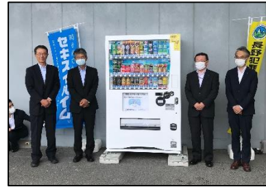
セキスイハイム信越(株)設置の寄付型自販機