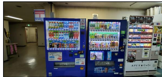
岡谷市役所の寄付型自販機