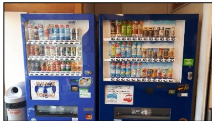
園山荘の寄付型自販機

・令和2年3月にセキスイハイム信越(株)に設置された寄付型自販機について、6月26日にお披露目式を執り行い、その様子が信濃毎日新聞、読売新聞、市民タイムスに掲載された。