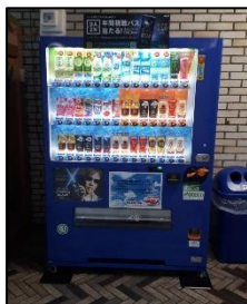
長野県庁の寄付型自販機