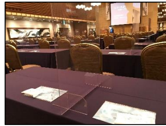
会場の新型コロナウイルス感染防止対策